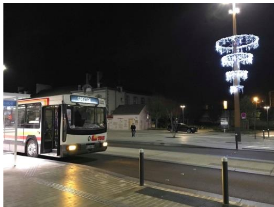
Le Renault PR 100.2 n°235 à l'arrêt pour une séance photos à la Gare Centre.

Le 14 décembre dernier, les membres étaient conviés à une balade nocturne à bord du Renault PR100.2 n° 235. Ils ont pu découvrir le marché de Noël de Trégueux, puis les illuminations de Noël dans l'hyper-centre de Saint-Brieuc. A la suite de cette sortie, les membres ont partagé un repas convivial au siège de l'association.