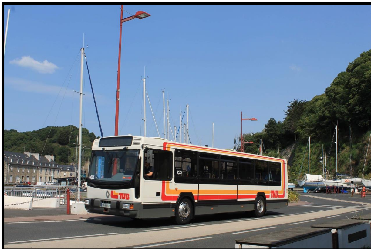
Le Renault PR 100.2 n°235 se promenant au légué à Saint-Brieuc.

Le journal d'information semestriel de l'association