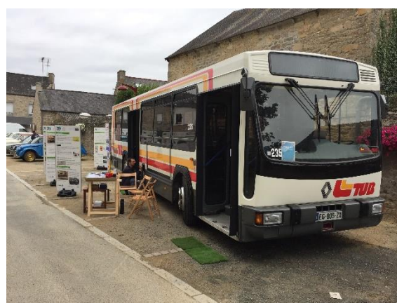
Ploec-L'Hermitage, le PR 100.2 n°235 exposé en compagnie de voitures anciennes.

La foire de Ploec-L'Hermitage est un événement qui rassemble associations, commerçants et services de la commune pour assurer une journée de fête aux habitants de Ploec-L'Hermitage et de ses alentours. Musiques, jeux, exposition de véhicules anciens, village des vieux métiers et concours de boules ont rythmé cette journée. HistoTUB était conviée pour la première année à y exposer son autobus Renault PR100.2 n° 235 fraîchement restauré et à présenter l'exposition des 70 ans des TUB.