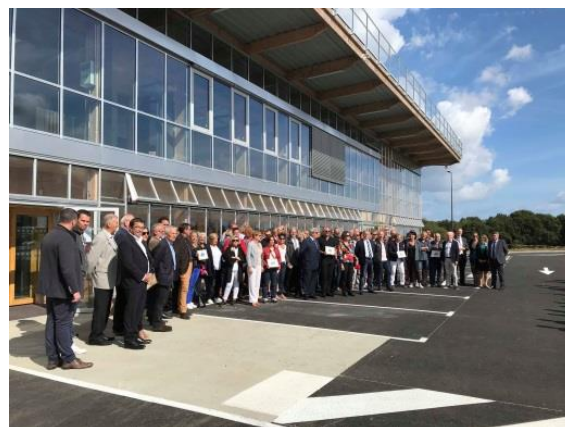
L'inauguration du nouveau dépôt des TUB.

d'activités des Châtelets, partagé entre les communes de Tréguieux et Ploufragan. Cet événement était l'occasion de réunir les 180 salariés de la société publique locale Baie d'Armor Transports. Les employés ont symboliquement reçu les clés de leur nouveau lieu de travail des mains des élus de Saint-Brieuc Armor Agglomération. Doté d'un atelier de maintenance et de bureaux administratifs, l'ensemble du bâtiment principal occupe une surface de plus de 3.000 m 2 , 90 places sont dédiées au parcage des véhicules avec à long terme une capacité d'extension pouvant abriter près de 120 véhicules. L'association y a exposé son Renault PR 100.2 n° 235.