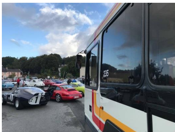
Shelby Cobra Daytona coupé, Porsche Carrera, Simca P60, Peugeot 203, Renault Dauphine et... Renault PR100.2, s'il vous plaît !

Le retour était prévu vers 13 h au parc des Promenades. Sur place, nous proposons de prolonger la sortie en partageant un pique-nique.