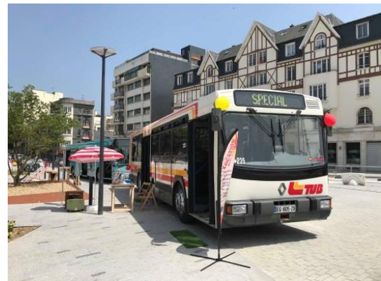
Place du Guesclin, le PR100.2 n° 235 exhibe fièrement sa silhouette de retraité fringant.

Enfin, les journées des 28 et 29 juin ont été consacrées à une exposition sur les 70 ans du réseau TUB, place du Guesclin.