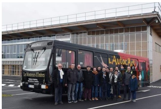
Le dernier entré dans la collection HistoTUB : le PR100.2 n° 211, devant le nouveau dépôt des TUB

Nous avons fait l'acquisition inattendue d'un cinquième véhicule, le 22 novembre 2019. Il s'agit du Renault PR100.2 n° 211 que l'association est allée chercher à Saint-Flour dans le Cantal pour le rapatrier jusqu'à sa ville natale. Cet autobus a été entièrement réaménagé en bus théâtre en 2002 et vadrouillait à travers la France depuis cette date. C'est une immense satisfaction d'avoir pu retrouver ce véhicule de 1985, véritable vestige du renouveau du transport urbain à Saint-Brieuc en 1985. Cédé à titre gracieux, cet autobus va conserver son âme de bus culturel et nous souhaitons le mettre à disposition des associations du bassin briochin.